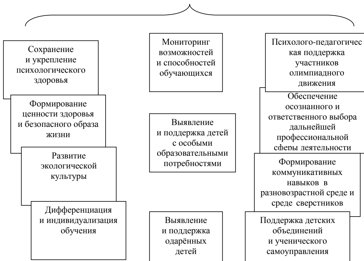
Аналитическая таблица для оценки базовых компетентностей педагогов